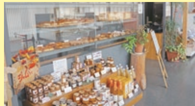
焼きたてパンの「プーランジェリーまるん」