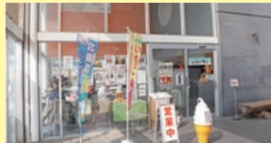
仁保の美味しさがその場で食べられる「にほのさんぼ」