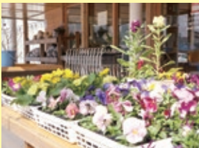
新鮮野菜で大人気の「仁保いろどり市」と「販売スペース」