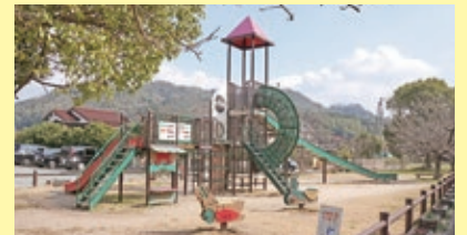
巨大な遊具がある「子供広場」