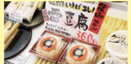
豆腐のうまみを凝縮！仁保名物「雷豆腐」