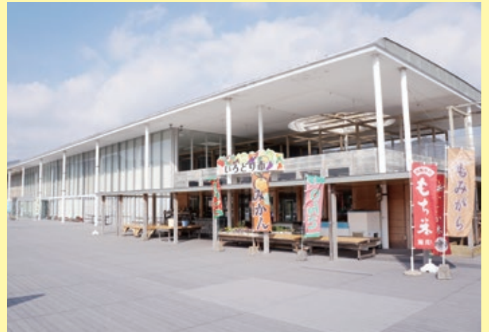
今年で20周年。仁保の顔として定着した道の駅

仁保・阿東地区で育った朝採れの新鮮な農産物や花がいっぱいの「仁保いろどり市」、季節を感じるふきやわらびなどの貴重な山野草などもあり一見の価値あり。野菜好きの方には大人気、お早めに！また、地元ならではの、お米（かじか米）やもち米の販売、精米もできます。中央の「販売スペース」には、仁保の特産品や山口の名物なども並んでいます。「レストランすこやか工房 にほさんぼ」での一品、豆腐のうまみが凝縮された大～きな豆腐、名物「雷豆腐料理」、ぜひご賞味ください。地元、秋川牧園の牛乳を使ったソフトクリームも大人気です。裏には子供広場もあり、これからのぼかぼか陽気に家族連れでも楽しめる道の駅です。